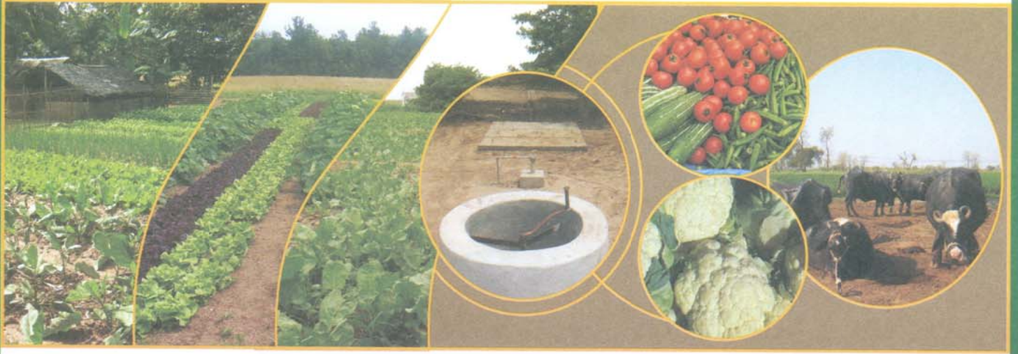
بائیوسلری کے نامیاتی اجزاء کی تفصیل*